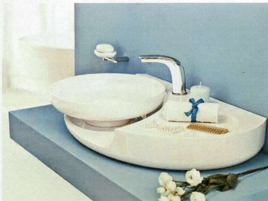
Angelica (design Massimiliano Settimelli) z kolekce Beauty Area inspirované krásou, zvlněné křivky a ladné oblé tvary, Webert