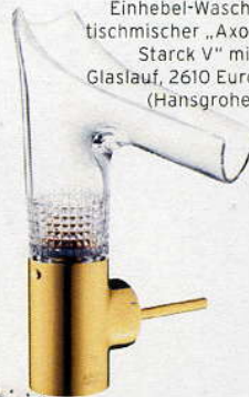
Einhebel-Waschtischmischer „Axor Starck V“ mit Glaslauf, 2610 Euro (Hansgrohe)