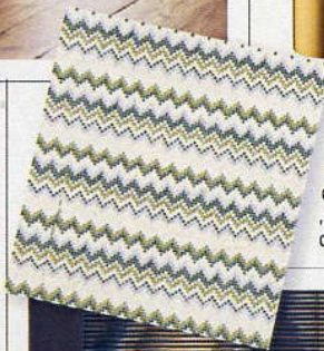
Im Zickzack verläuft das Muster auf Fliese „Mixoni B“, 901 Euro/qm (Margraf)