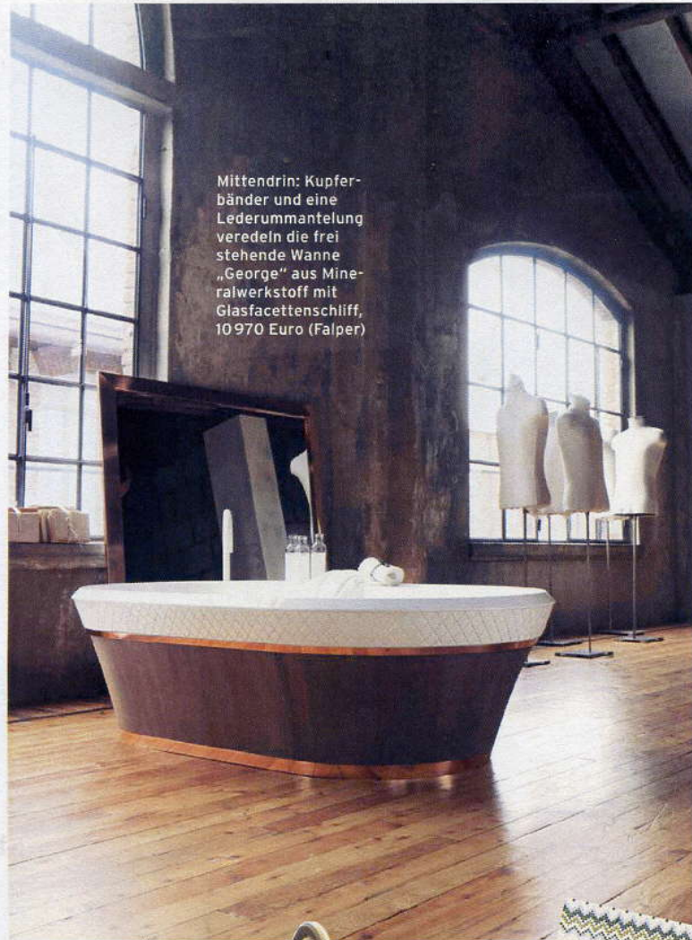
Mittendrin: Kupferbänder und eine Lederummantelung veredeln die frei stehende Wanne „George“ aus Mineralwerkstoff mit Glasfacettenschliff, 10 970 Euro (Falper)