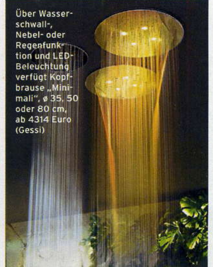
Über Wasserschwall-, Nebel- oder Regenfunktion und LED-Beleuchtung verfügt Kopfbrause „Minimal“, ø 35, 50 oder 80 cm, ab 4314 Euro (Gessi)