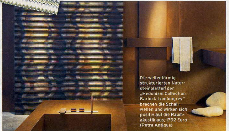
Die wellenförmig strukturierten Natursteinplatten der „Hedonism Collection Barlock Londongrey“ brechen die Schallwellen und wirken sich positiv auf die Raumakustik aus, 1792 Euro (Petra Antiqua)