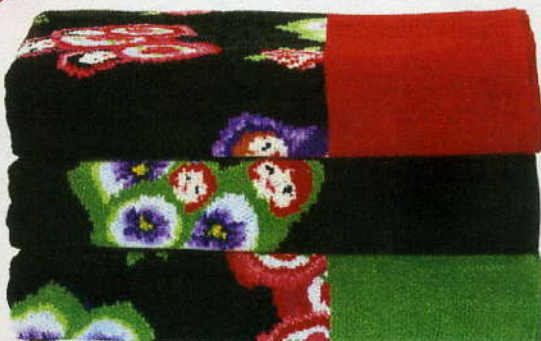
Für Püppchen und ganze Kerle gleichermaßen flauschig: Handtuchkollektion „Matruschkas“ aus Baumwollchenille, beidseitig gemustert, ab 12 Euro. Feiler, www.feiler.de