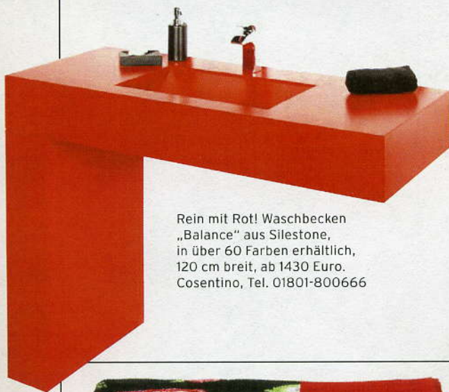
Rein mit Rot! Waschbecken „Balance“ aus Silestone, in über 60 Farben erhältlich, 120 cm breit, ab 1430 Euro. Cosentino, Tel. 01801-800666