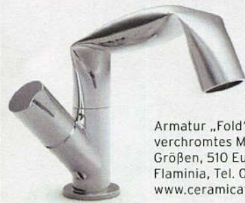
Armatür „Fold“ mit Knickoptik, verchromtes Messing, diverse Größen, 510 Euro. Ceramica Flaminia, Tel. 07131-585844, www.ceramicaflaminia.de