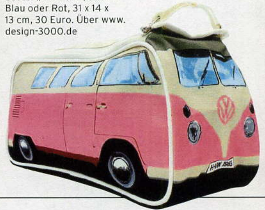
Treuer Gefährte: Kulturbeutel „VW Bulli“, auch in Blau oder Rot, 31 x 14 x 13 cm, 30 Euro. Über www.design-3000.de