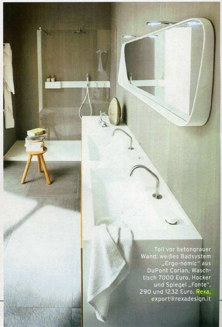
Toll vor betongrauer Wand: weißes Badsystem „Ergo-nomic“ aus DuPont Corian, Waschtisch 7000 Euro. Hocker und Spiegel „Fonte“, 290 und 1232 Euro. Rexa , export@rexadesign.it