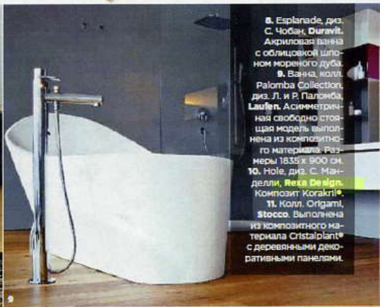
8. Esplanade, диз. С. Чобан, Duravit. Акриловая ванна с облицовкой шпоном мореного дуба. 9. Ванна, колл. Palomba Collection, диз. Л. и Р. Паломба, Laufen. Асимметричная свободно стоящая модель выполнена из композитного материала. Размеры 1835 x 900 см. 10. Hole, диз. С. Манделли, Rexa Design. Композит Korakri®. 11. Колл. Origami, Stocco. Выполнена из композитного материала Cristalplant® с деревянными декоративными панелями.